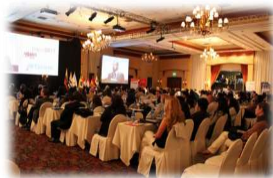
Disertación en el Congreso

Del 26 al 28 de octubre de se realizo en Quito el CIGEH 2011 - XXII CONGRESO INTERTERAMERICANO DE GESTIÓN HUMANA Y sin Fronteras, Infinitas posibilidades" .