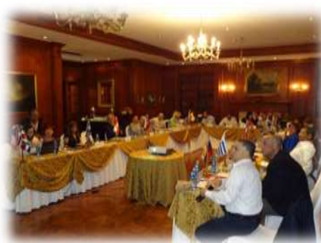
Asistentes a la Asamblea de FIDAGH