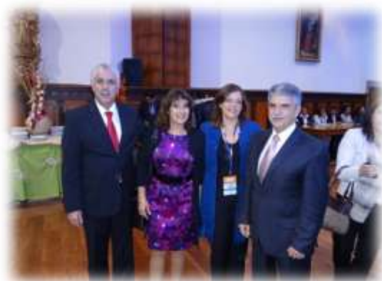
Representantes de Uruguay en el CIGEH

Del 26 al 28 de octubre de se realizo en Quito el CIGEH 2011 - XXII CONGRESO INTERTERAMERICANO DE GESTIÓN HUMANA Y sin Fronteras, Infinitas posibilidades" .